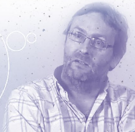
© Anne Jaffrenou & Marie Cuisset

Katherine Fitzgerald Canada, 2008 Fiction ~ 7'00" Un astronome qui tend vers l'infiniment grand et un passionné qui se concentre sur l'infiniment petit.